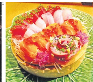
Usuzukuri de atum, salmão, dourada e carapau sobre o gelo

estes buscam a perfeição até à exaustão. Por exemplo, para cozer o arroz no ponto certo é preciso um processo de aprendizagem de oito anos. “Selenta por cento da cozinha japonesa é saber tudo sobre o arroz” , disse o chef, referindo-se não só à lavagem, como à cozedura. É preciso ainda conhecer bem este produto que varia muito ao longo do ano por causa da humidade. É e preciso ter uma noção apurada da água com que se coze pois este “não pode ficar empapado nem seco” .