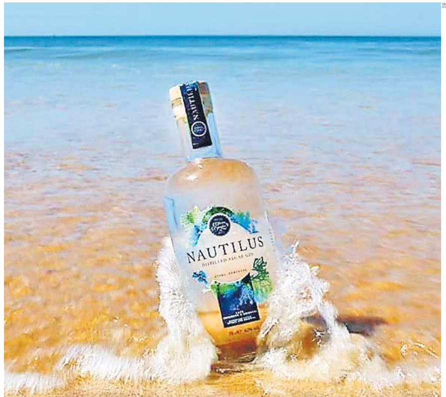
O Nautilus é um gin de tripla destilação obtido a partir de produtos naturais e aromatizado com algas marinhas

A escola pretende continuar a apostar nas algas na composição de produtos alimentares e, depois do pão e do gin, Raul Bernardino promete mais novidades para breve.