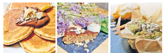
O “food design” alia a comida ao design