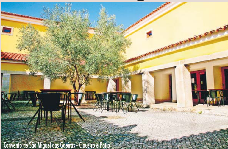
Convento de São Miguel das Gaeiras - Claustro e Pátio

Situado no magnífico convento Franciscano do Séc XVI este espaço de restauração em Gaeiras oferece excelentes condições para a realização de eventos de todos os géneros.