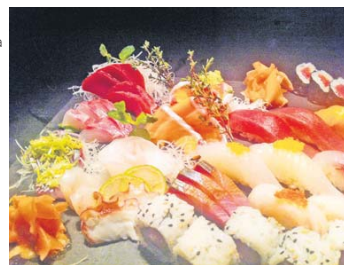
Combinado Sushi to Sashimi composto por Uramaki, Hosomaki, Nigiri e Sashimi