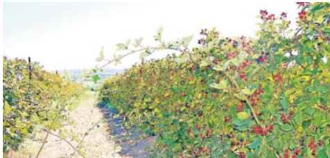
Amoras e tomate azul são alguns dos produtos que estão actualmente para venda nas Colheitas d'Óbidos

Colheitas d'Óbidos tem as suas portas abertas de segunda-feira a sábado, entre as 9h00, e as 18h00 e ao domingo, entre as 9h00 e as 13h00. Pode também ser encontrada no facebook. ■