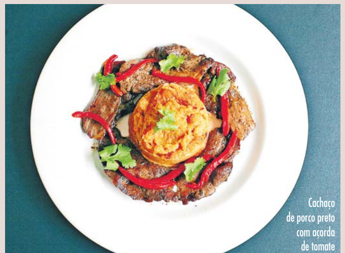
Cachaço de porco preto com açorda de tomate

periodicamente com novas sugestões. Um conjunto variado de petiscos a 5,50€: pimentos padrão, ovos com farinha de Seia, queijo de cabra com pesto, cogumelos salteados com linguça e coentros, paté caseiro de fígados, bolinhos de alheira com chutney, morcela assada com maçã. Entre os pratos principais dos 9€ aos 12€: Linguini com gambas coco e lima, bacalhau com broa e lombardo, arroz de polvo, rosbife de picanha e batatas assadas, cachaço de porco preto com açorda de tomate, risoto de abóbora assada, vinho moscatel e queijo da ilha. Info: cantinacriativa@gmail.com ; facebook/cantinacriativa ; tripadvisor