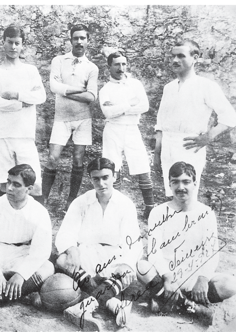
12 Ainda antes da fundação do Caldas SC, esta terá sido a equipa que esteve na origem do clube.