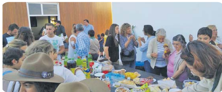
Confraternização dos escuteiros com os pais