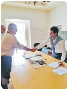
Assinatura do Protocolo de cedência pela Câmara da antiga escola de Trás do Outeiro, para sede do agrupamento dos escuteiros.