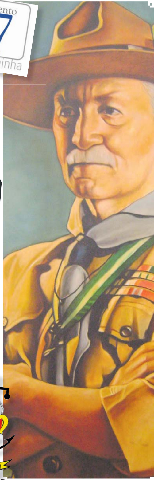
São Martinho do Porto