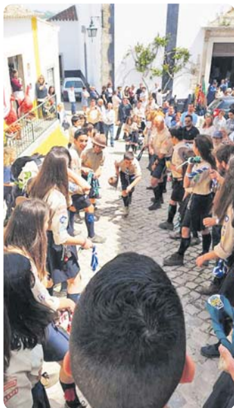
Após Promessas, à saída da igreja de São Pedro, na vila de Óbidos

Éis alguns dos serviços prestados à comunidade pelos Escuteiros de Óbidos: proteção civil municipal, apoio a peregrinos, Banco Alimentar, apoio a caminhadas solidárias e colaboração com os Guias de São Lourenço que ajudam pessoas carenciadas.