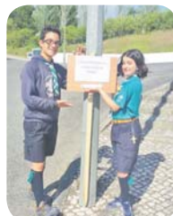
Apoio dos escuteiros a peregrinos