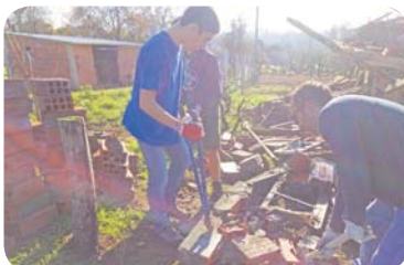
Exemplo de ação solidária com vítimas de incêndios do passado outubro