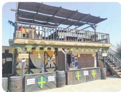
Participação no Mercado Medieval através da construção da Taberna Real e da confeção de deliciosas refeições