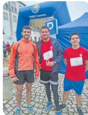
Escuteiros de Óbidos participantes na Corrida do Chocolate, com um percurso de 10 km.