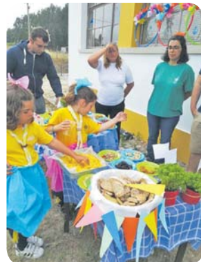
Celebração dos Santos Populares