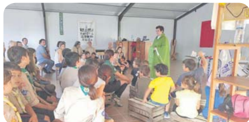
Celebração da missa na nova sede do agrupamento de Óbidos