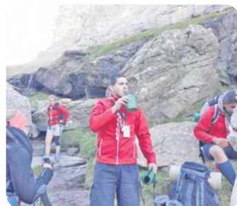
Participação em atividade internacional, em Griebal (Espanha).