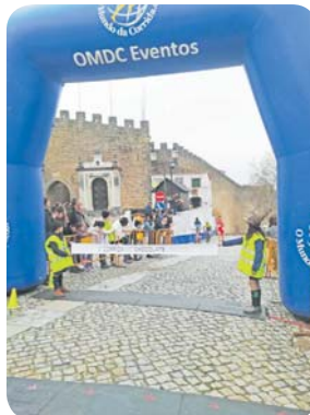
Apoio à Corrida do Chocolate em 17 de março de 2018